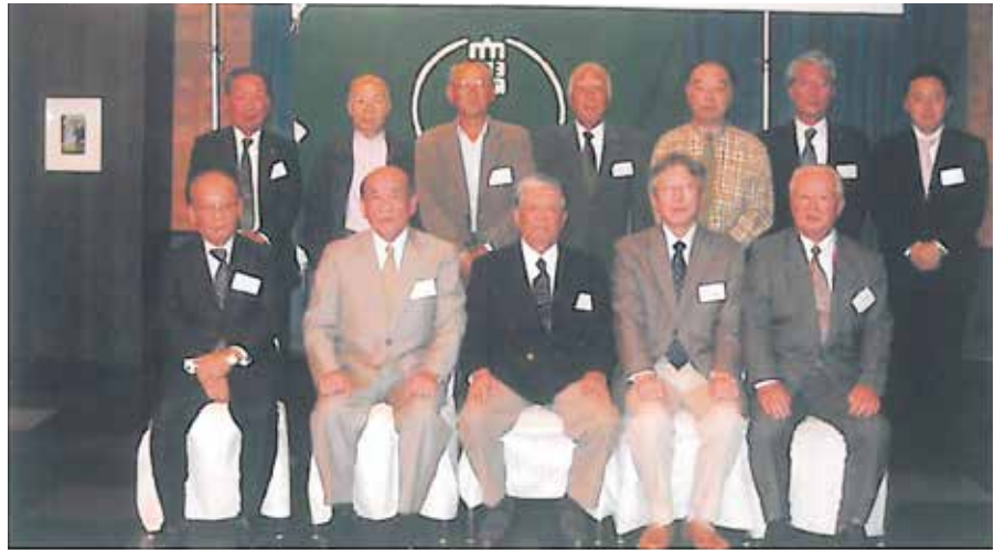
嘉飯支部会 平成26年10月25日 於 パドドウ・ル・コトブキ

今年は卒業して47年ぶりに同窓会に参加した人、卒業して5年ぶりに地元で就業しているという新しいメンバーも増えて、懇親会では新旧のメンバーを交えて在学時代の思い