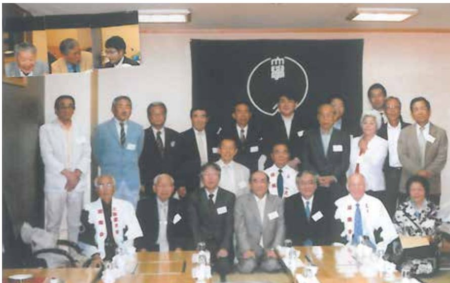
福岡県南支部会 平成26年5月10日 於 割烹しげちゃん