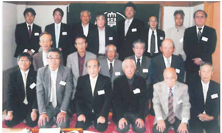
鳥栖・三養基支部会 平成26年3月30日 於 光林飯店

ち、建学の精神に戻り、卒業生として、地元可愛され親しまれて筑後地区で存在感をましていく大学を顧み、全員一層、支部での懇親の輪を広げ、他支部との連携を計り、支部全員の増強を祈念し、万歳三唱で散会した。