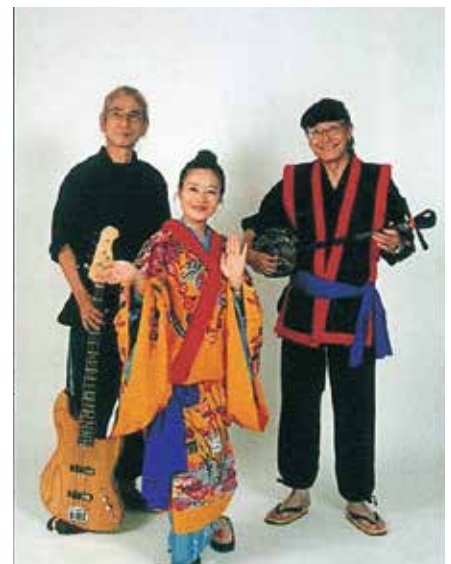
特別出演 三線ロビンス