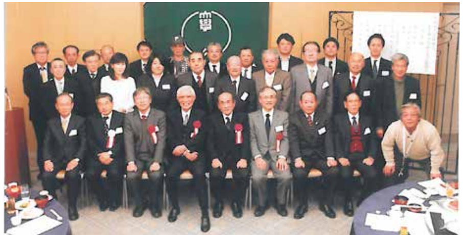
北九州支部会 平成26年2月15日 於 リーガロイヤルホテル小倉

同窓会のあり様も時代の変化とともに、変化で対応して行かねばなりません。こんな時代だからこそ、同窓会が存在するだけでなく、必要とさ