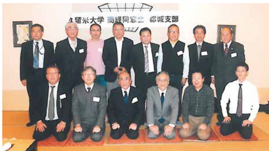
都城支部会 平成26年1月25日 於 川声