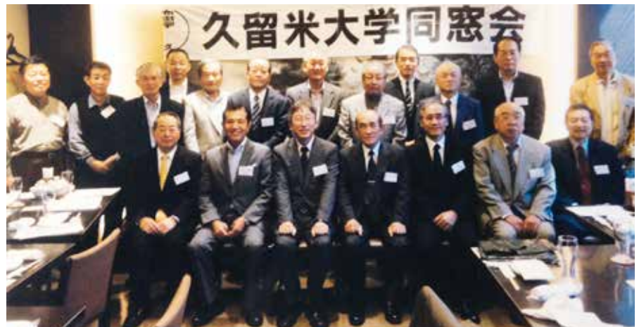
関西支部会 平成26年10月26日 於 ロドス