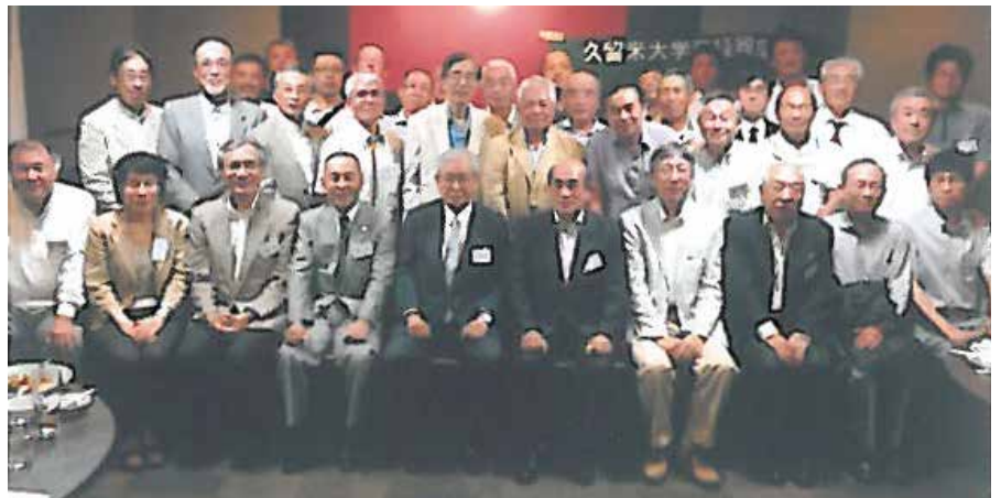
宮崎支部会 平成26年7月19日 於 東天閣