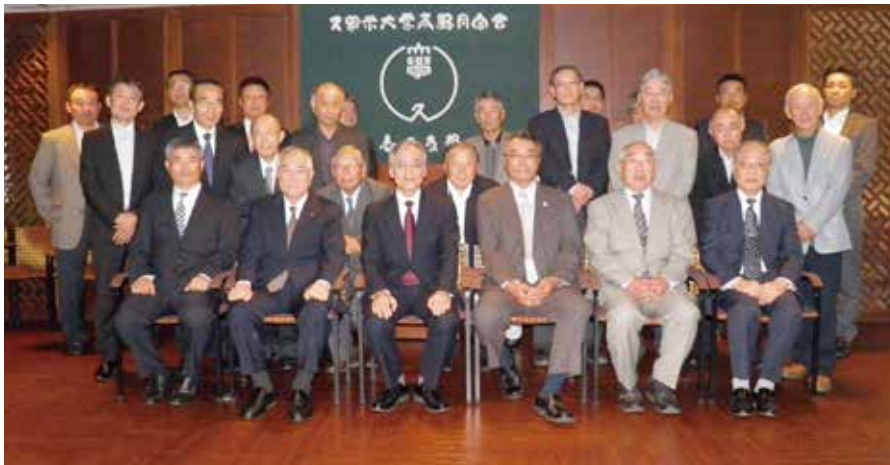
長崎支部会 平成26年10月25日 於 ホテルニュー長崎