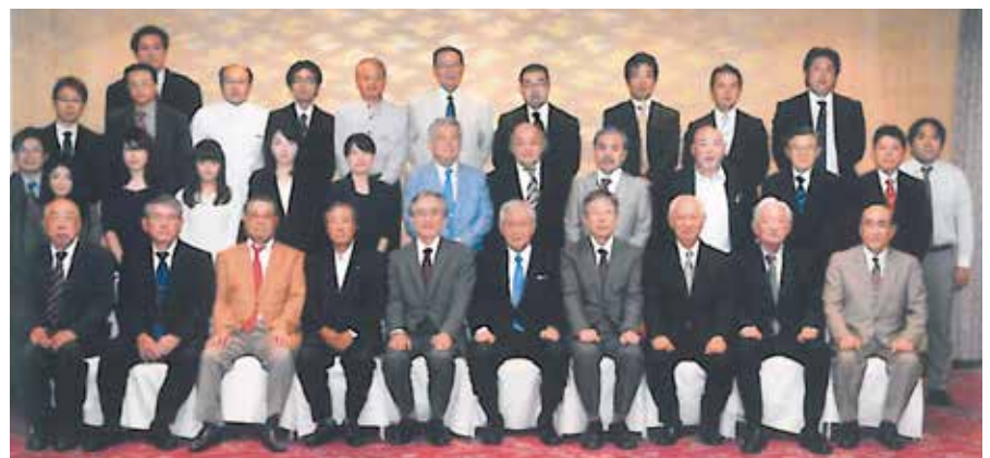
日田支部会 平成26年10月4日 於 亀山亭ホテル

久留米大学の現状及び今後の方針についてお話しがあり、大木会長より同窓会活動の現状についてお話しが