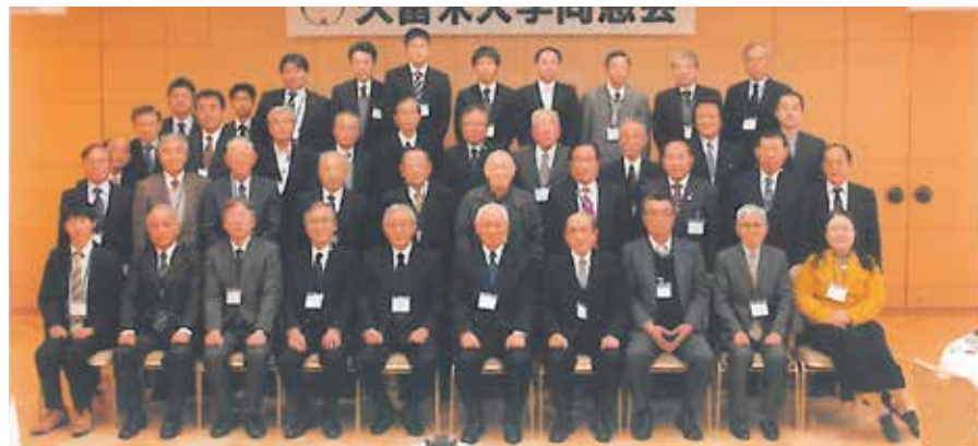
佐賀県支部会 平成26年3月9日 於 グランデはがくれ

最後に全員で懐かしい校歌を思い出しながら斉唱し、万歳三唱をして、来年への再会を誓い合っ、盛会のうちに支部会を無事終了することが出来ました。