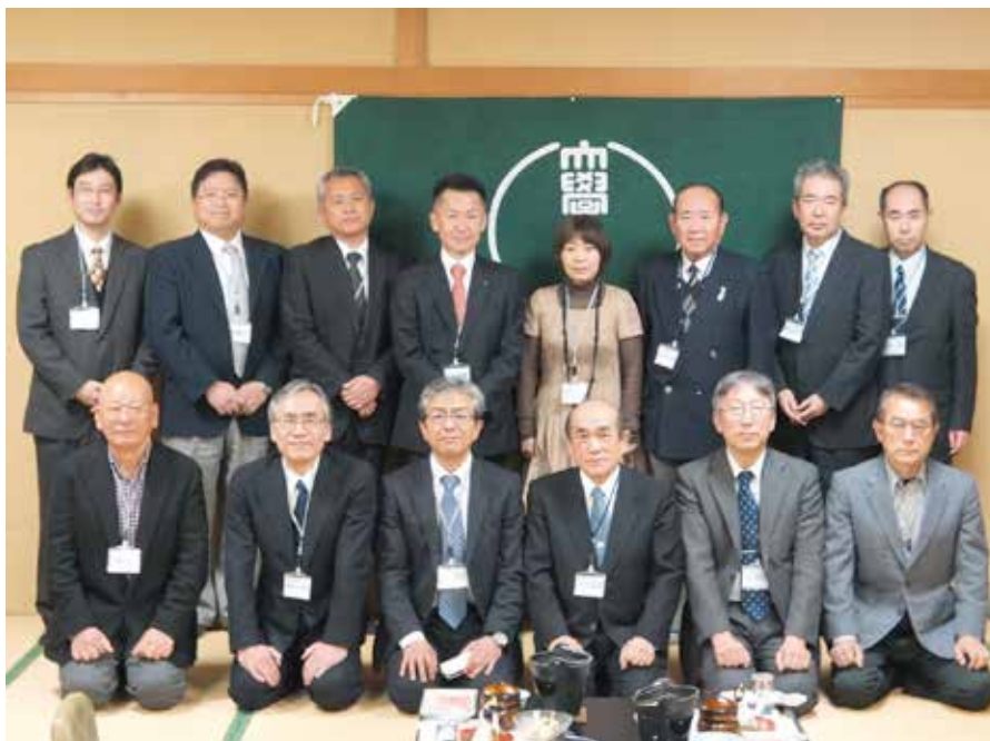
八女支部会 平成26年2月22日 於 いわ井